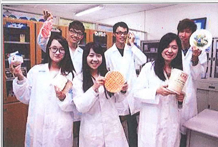
保營系營養諮詢課程讓學生對食物更加認識