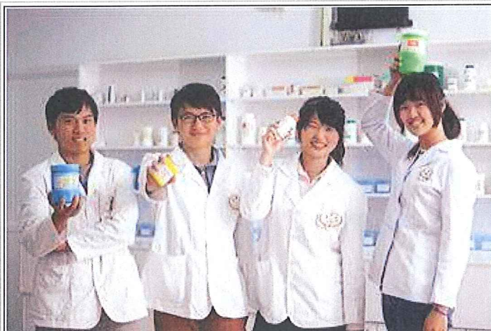
嘉藥藥學系學生於實習藥局體驗職場環境