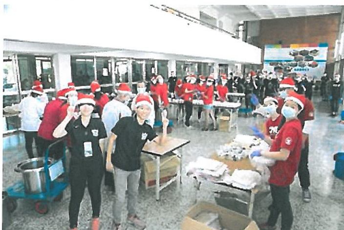
嘉藥議會每年固定舉辦冬至愛心湯圓義賣活動