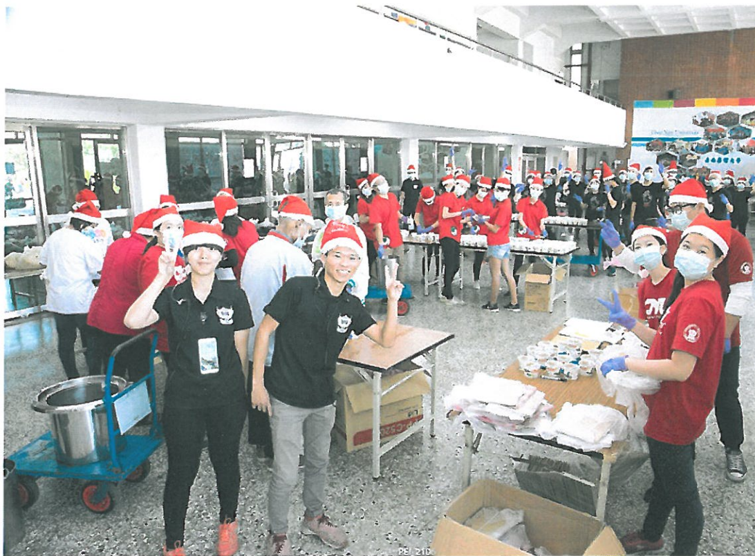
嘉藥議會舉辦冬至愛心湯圓義賣活動。