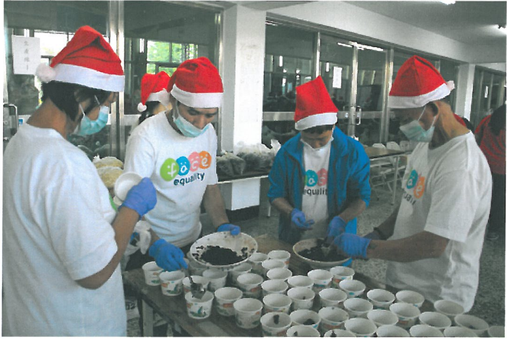
陽光基金會口腔癌病友也來幫忙分裝湯圓，展現愛心。

冷氣團將到來，嘉南藥理大學昨天舉行愛心湯圓義賣活動，一碗碗熱騰騰的湯圓捧在手心，備受學生歡迎，一天就義賣六萬多元，所得全數捐助學校的「圓夢助學計畫」基金，幫助家境艱困的學生繼續完成學業。