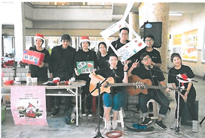
嘉藥吉他社成員為義賣活動增添熱鬧氣氛