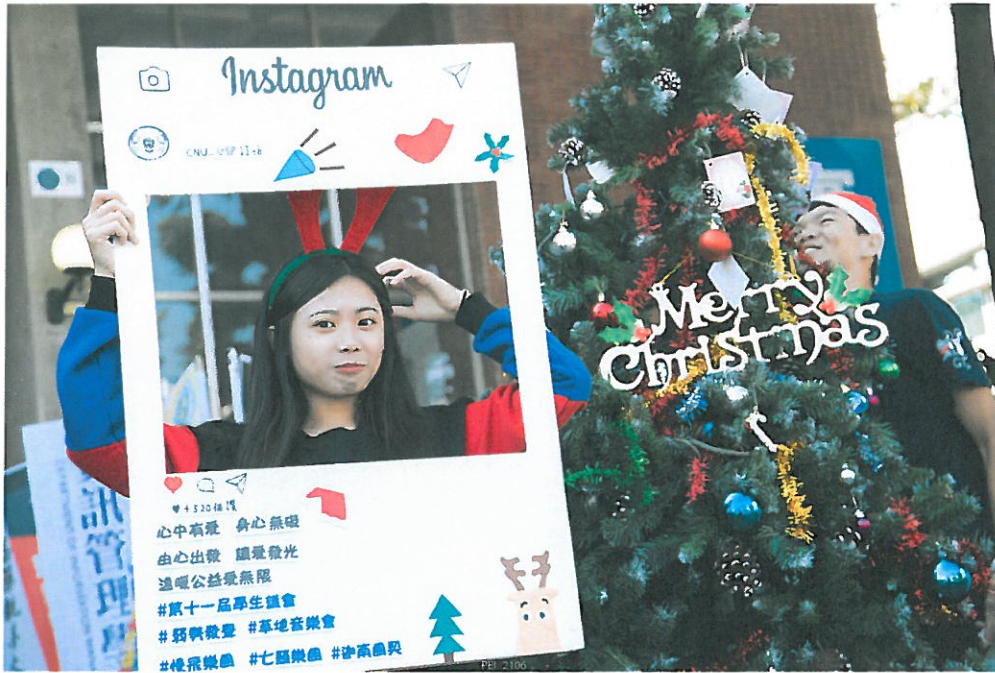
嘉藥學生提前慶祝冬至及聖誕

寒流即將入境，嘉南藥理大學校園依然熱情洋溢，該校年度盛事愛心湯圓義賣活動，於12月14日上午10時在大禮堂熱鬧登場。一碗碗熱騰騰的湯圓捧在手心，除了讓離鄉求學的學生感受到家的溫暖，也藉由義賣所得捐助學校圓夢助學基金，幫助家境艱困的同學繼續完成學業。