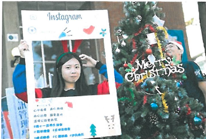
嘉藥學生提前慶祝冬至及聖誕節