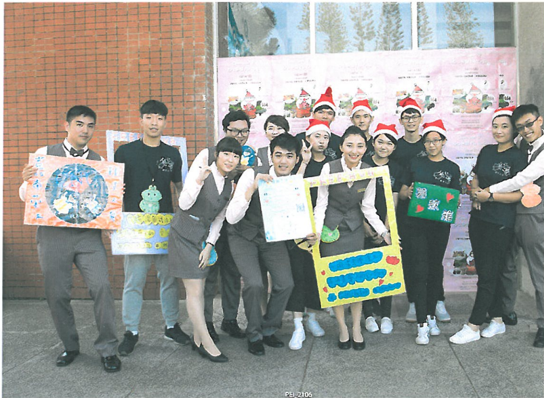
嘉藥社團熱烈響應湯圓義賣活動。