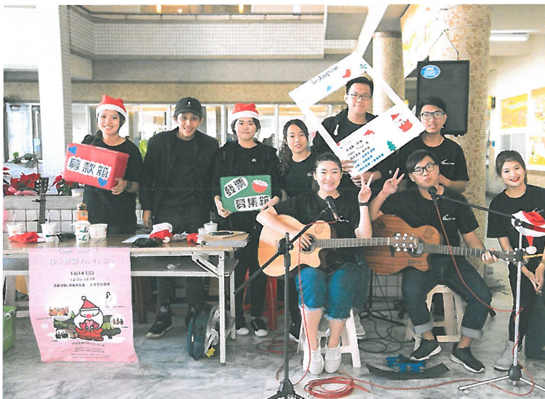
吉他社成員為義賣活動增添熱鬧氣氛。