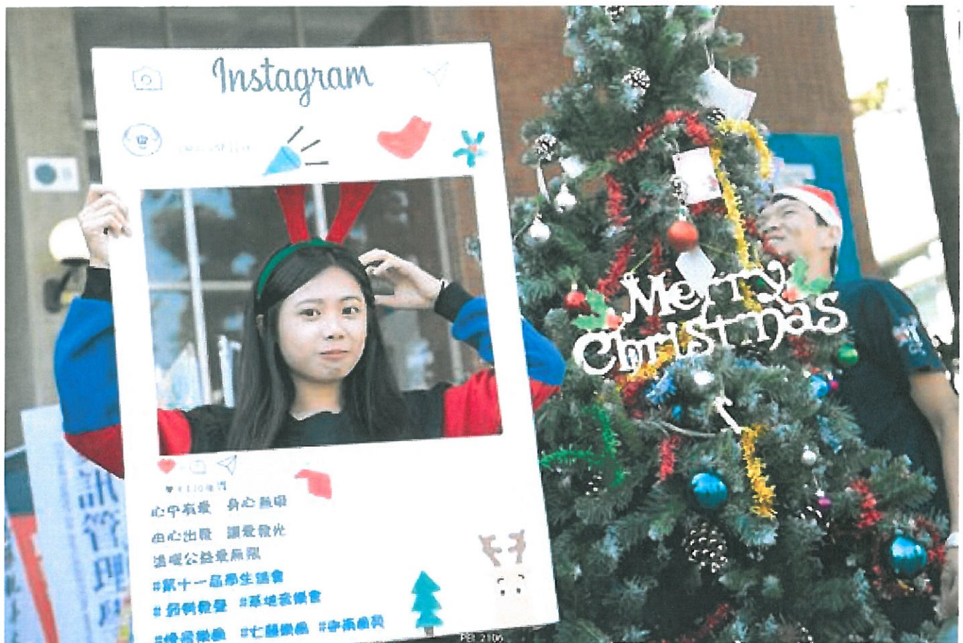
嘉藥冬至愛心湯圓義賣傳承十年情

(中央社訊息服務20161214 14:06:21)寒流即將入境，嘉南藥理大學校園依然熱情洋溢，該校年度盛事愛心湯圓義賣活動，於今天上午10時在大禮堂熱鬧登場。一碗碗熱騰騰的湯圓捧在手心，除了讓離鄉求學的學生感受到家的溫暖，也藉由義賣所得捐助學校圓夢助學基金，幫助家境艱困的同學繼續完成學業。