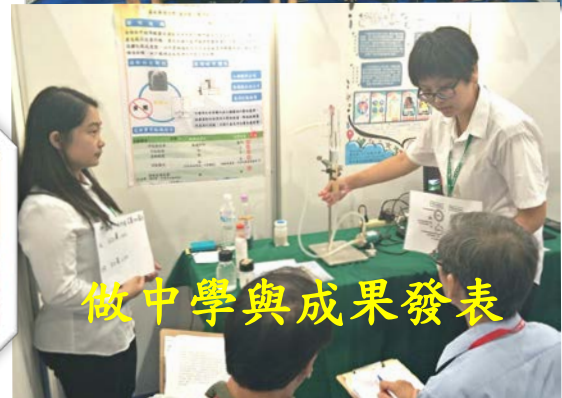
做中學與成果發表