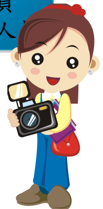
觀光產業行銷與企劃 人員

溫泉產業行銷與解 說人員 觀光遊樂業畫行銷 與解說人員 文化觀光從事人員 遊憩區服務人員 旅遊資訊服務人