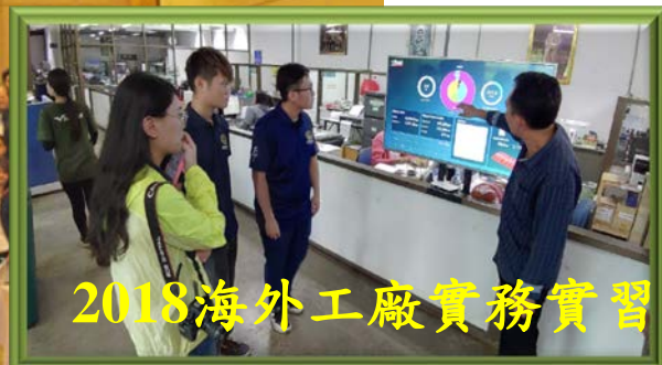
2018海外工廠實務實習