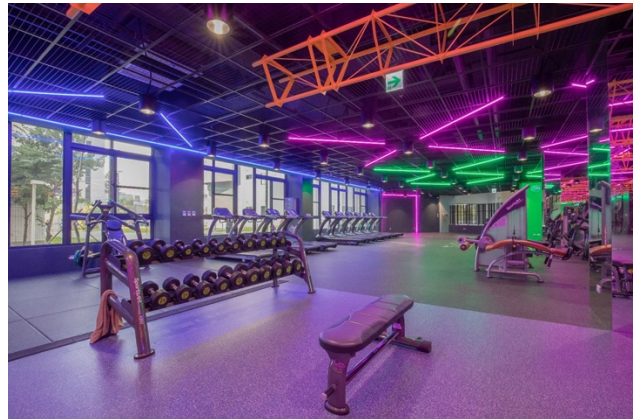
公共空間參考圖 Public Spaces Không gian công cộng