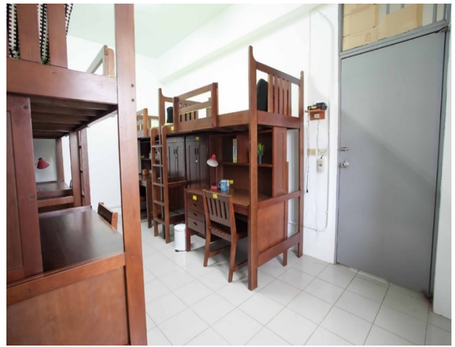
房間設備參考圖 Dormitory Room Furnishing Trang thiết bị nội thất ký túc xá