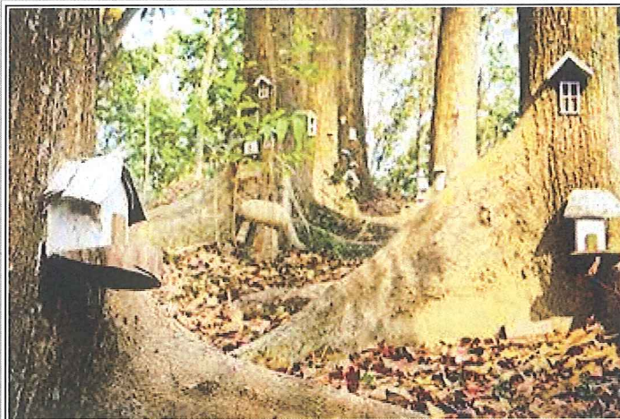
新化國家植物園內的神秘小樹屋