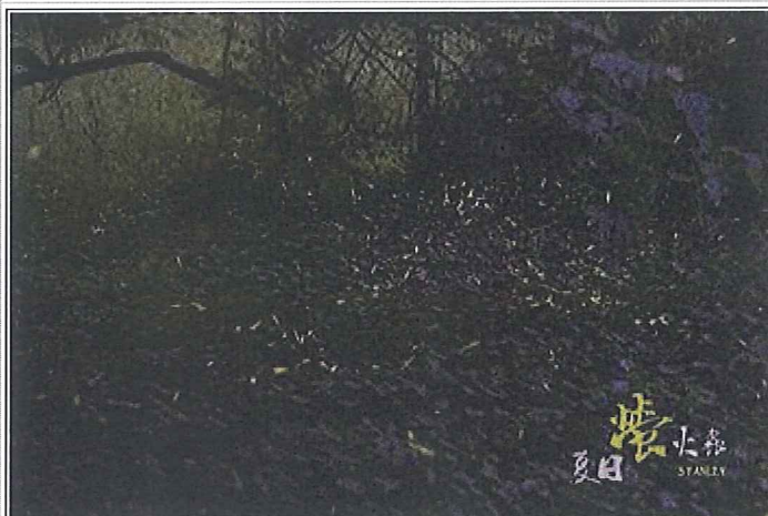
新化國家植物園的夏日螢火蟲即將炫麗登場