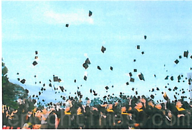
嘉藥畢業生以拋帽完成畢典儀式。