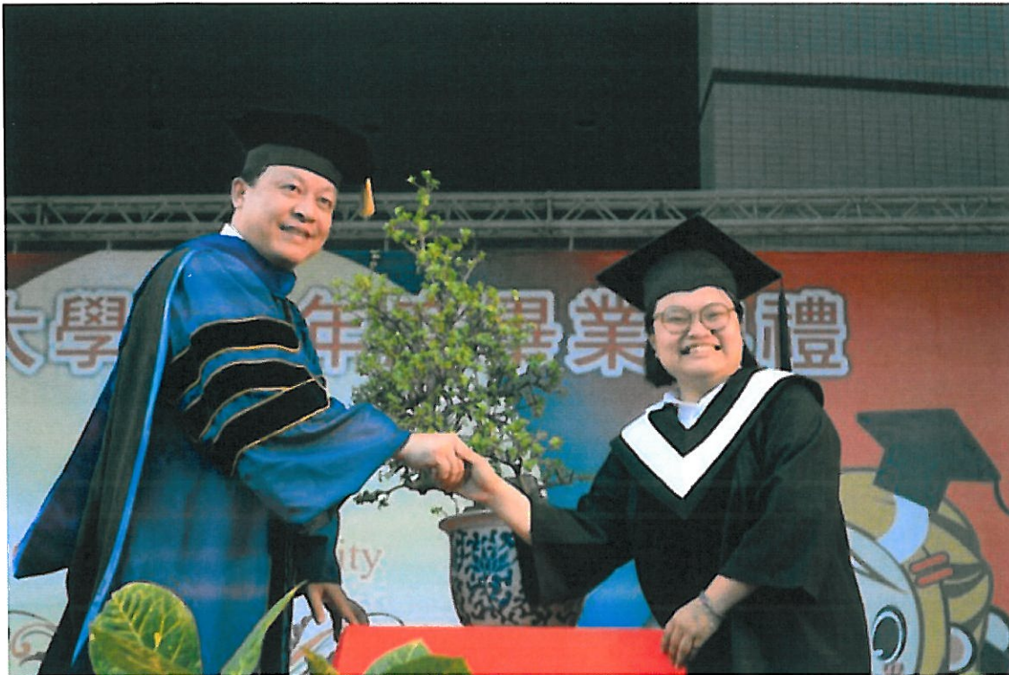
▲十年樹木，百年樹人。畢業生贈送學校培育4年的盆栽。