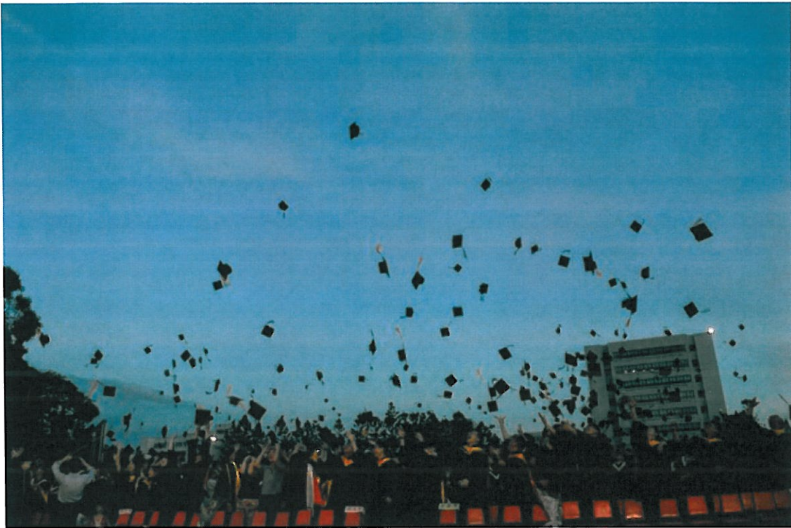
▲禮成後，畢業生將帽子拋向高空，祝福自己前途高遠。