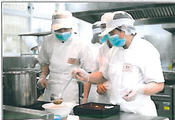
餐旅系學生參加台南市政府舉辦老人膳食設計比賽