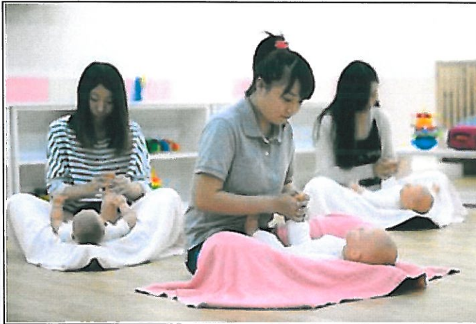
嘉藥幼保系嬰幼兒照護實作課程