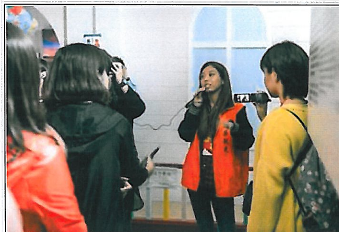
觀光系學生修讀領隊實務課程實際帶隊出訪