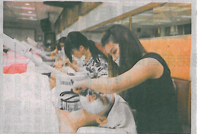
↑參加妝品系就業學程學生練習為客人敷臉。

件數年年領先所有大學校院，冠居全國。該計畫除輔導學生考取相關證照、參加國內外重要競賽，也提供業師協同教學，讓大四學生到企業職場體驗，提早和業界接觸並參與實作。嘉藥執行這項計畫成績耀眼，參訓學程的畢業生三個月後就業率平均高達八成，化妝品應用與管理系等多個系畢業生就業率甚至達百分之百。