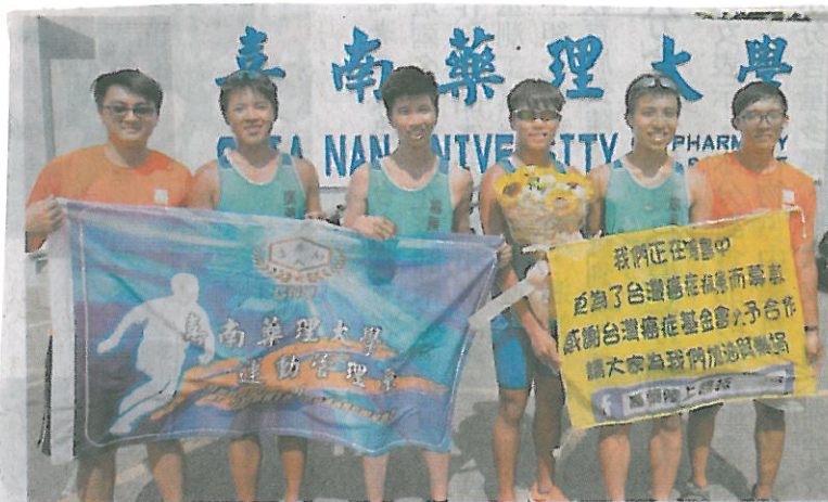
嘉藥學生為愛而跑，環台返校，獲得英雄式歡迎。