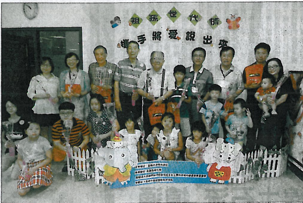
↑ 社會局、台灣首廟天壇結合嘉南藥理大學、萬龍國際教育協會，九日舉辦「溫馨祖孫世代情、攜手將愛說出來」活動。