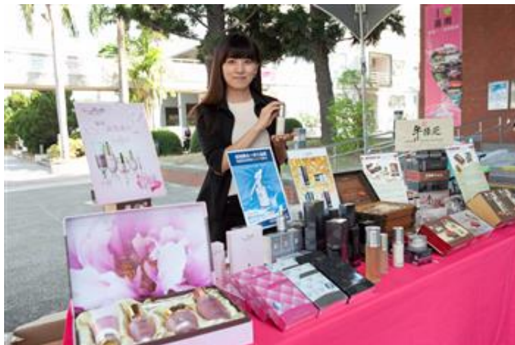
學校生科系老師技轉之牛樟芝系列產品