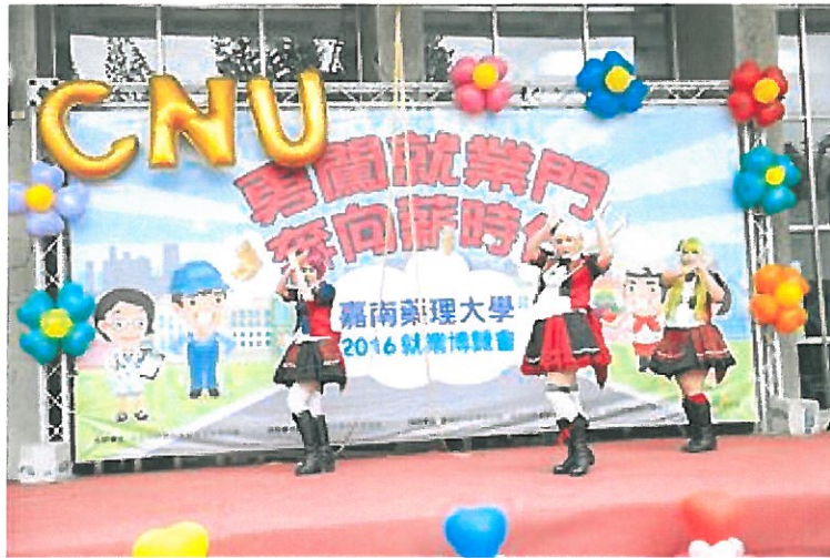
活潑的社團表演為就業博覽會揭開序幕