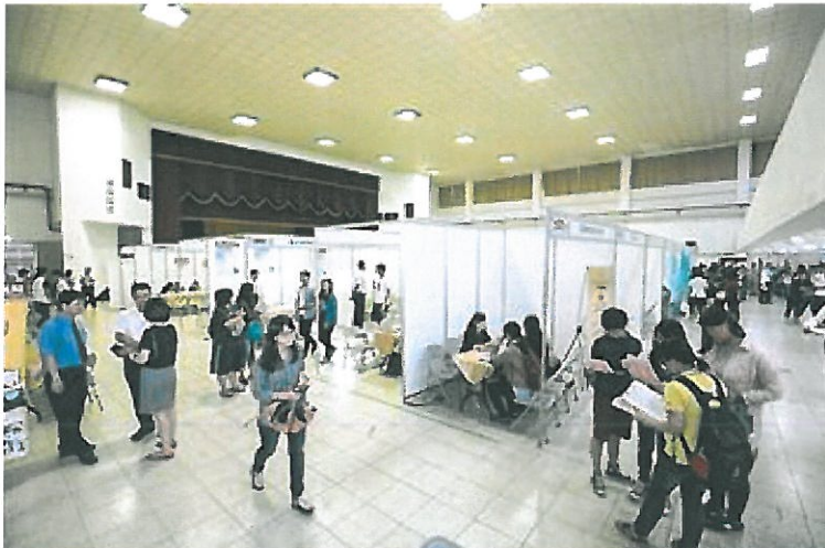
嘉藥就業博覽會吸引眾多大四生前往參加