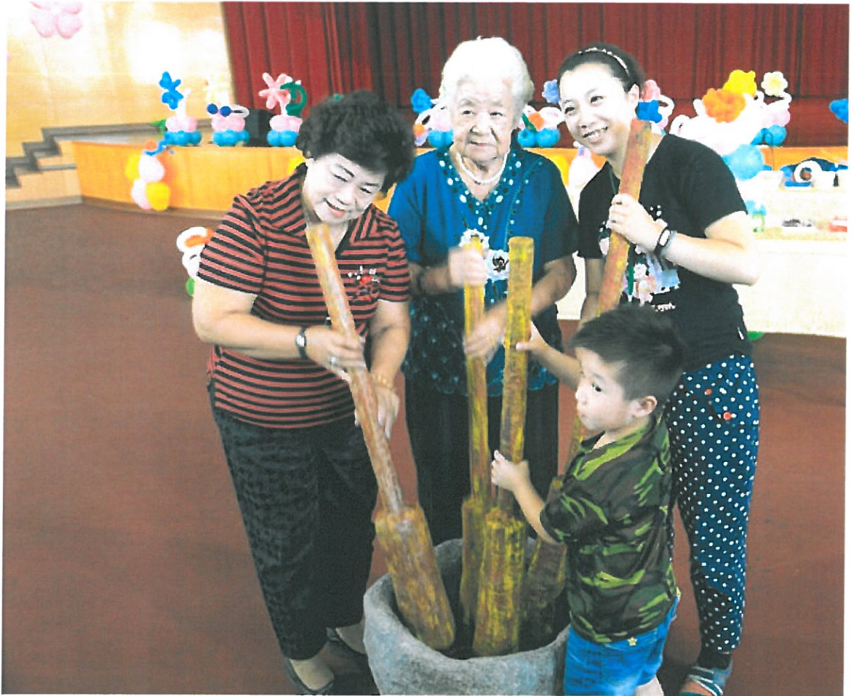
祖孫三代一起合作禱麻糬，代表家庭和樂和緊密連結。