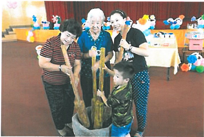
祖孫三代一起合作擣麻糬，代表家庭和樂和緊密連結