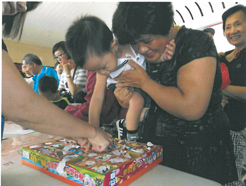
昨天是祖父母節，社會局與嘉南藥理大學舉辦闖關活動，抱在懷裡的小孫子鍾情於戳戳樂，急著戳破試手氣。

昨天是祖父母節，市府社會局與嘉南藥理大學舉辦「世代傳情、讓愛延續」活動，現場吸引二百多個家庭、上千人參加，祖孫一起體驗小時候童玩戳戳樂、套圈圈，讓時光倒轉回到從前。