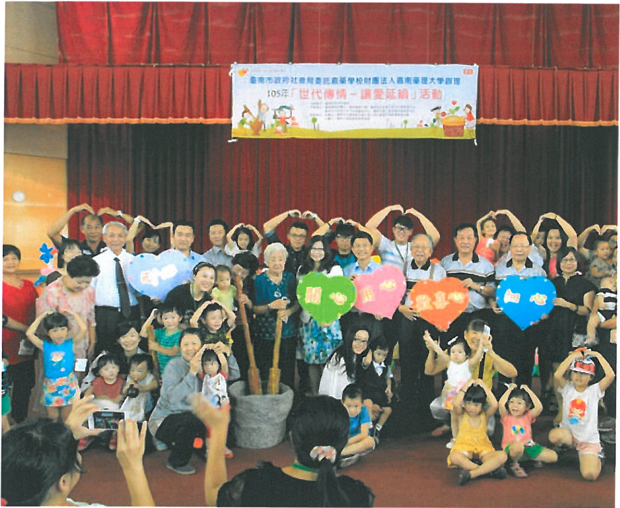
主辦和協辦單位一起大合照。