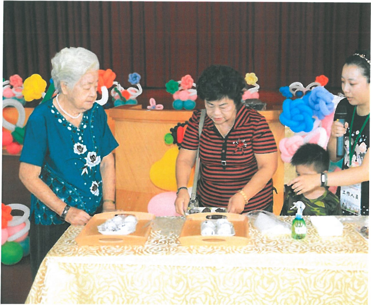
祖孫三代一起包麻糬，將情感包在麻糬裡，傳承下去。