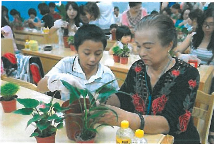
祖孫一同創作增進感情