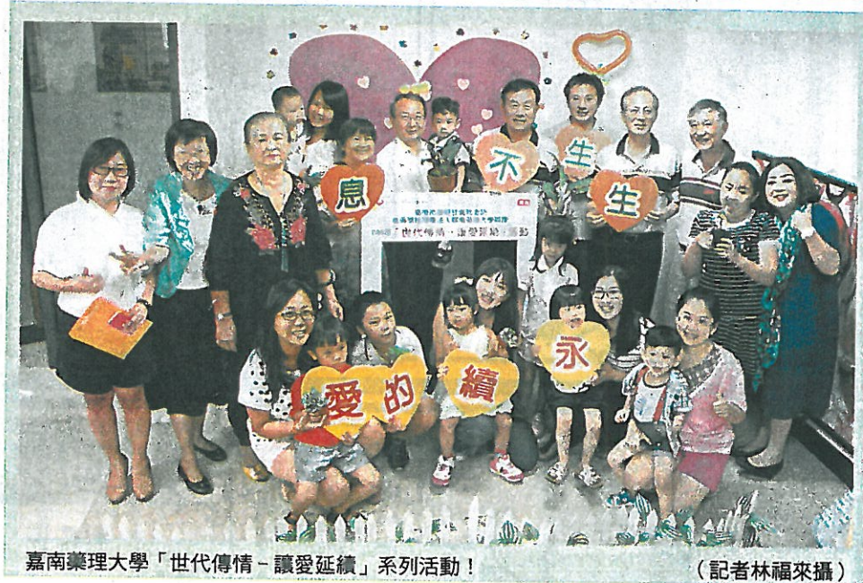
嘉南藥理大學「世代傳情-讓愛延續」系列活動！

莊董事長特別感謝臺南市政府社會局，爭取公益彩券盈餘為大臺南鄉親舉辦如此有意義的活動，更對籌劃所有活動的嘉藥幼保系團隊，致上敬佩之意。