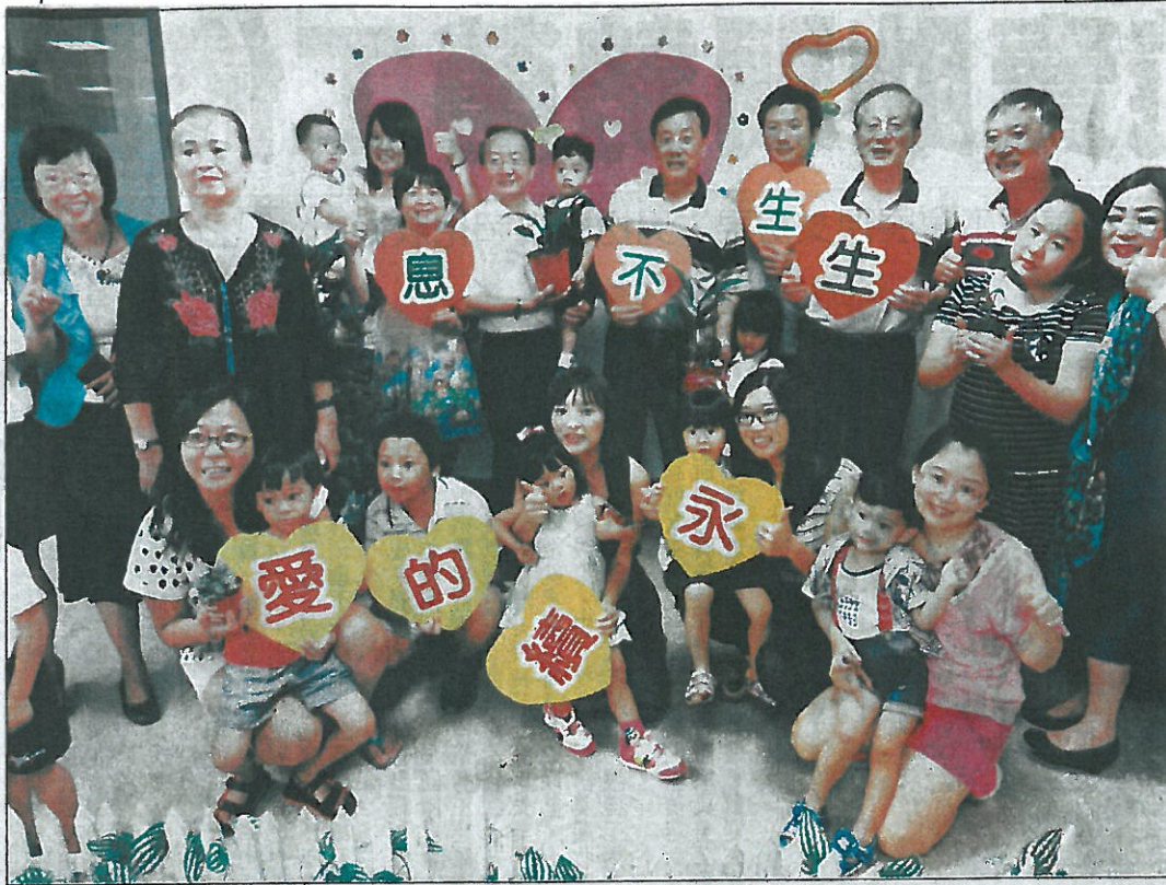
← 社會局、台灣首廟天壇十一日舉辦「世代傳情—讓愛延續」，營造家庭和樂氣氛。