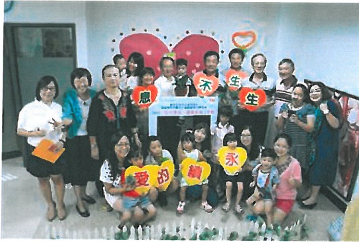
嘉藥辦理世代傳情讓愛延續活動圓滿結束