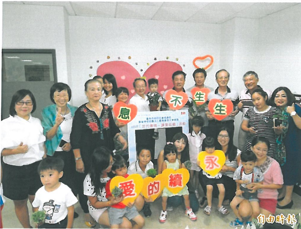
台南首廟天壇辦世代傳情讓愛延續活動，爺嬭傳承小盆栽給孫子女，象徵生生不息。