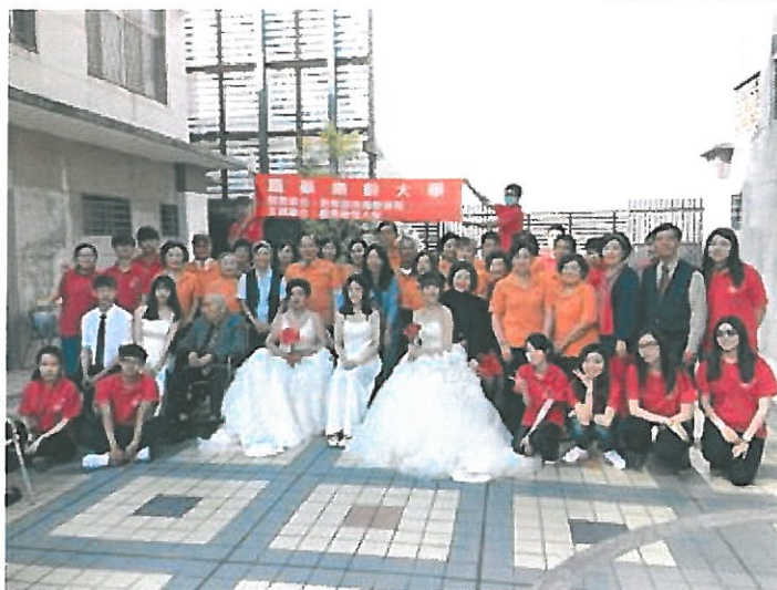
嘉藥辦理圓夢婚禮