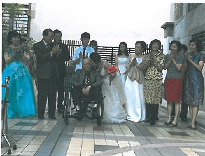
黃奶奶獻上甜蜜的一吻