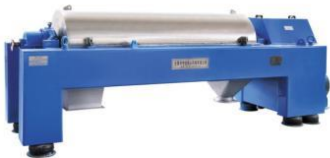
廢水處理廠板框式污泥脫水機 (上圖)，離心式污泥脫水機(下圖)