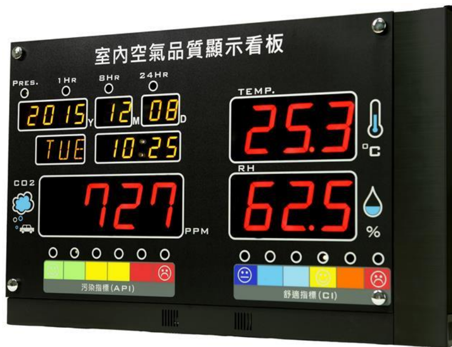
室內空氣品質監測看板