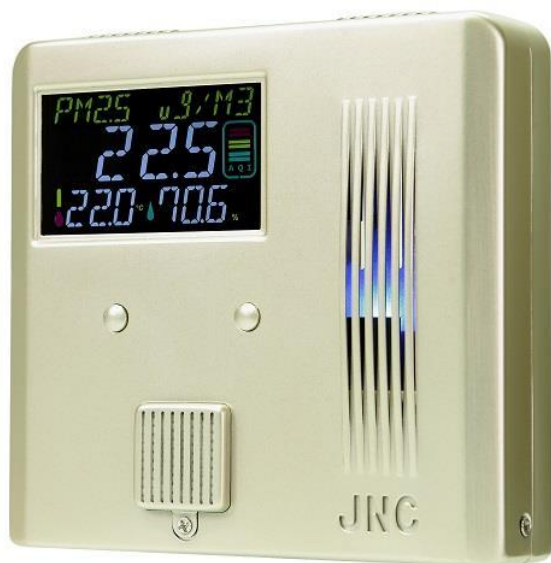
七合一室內空氣品質監測器