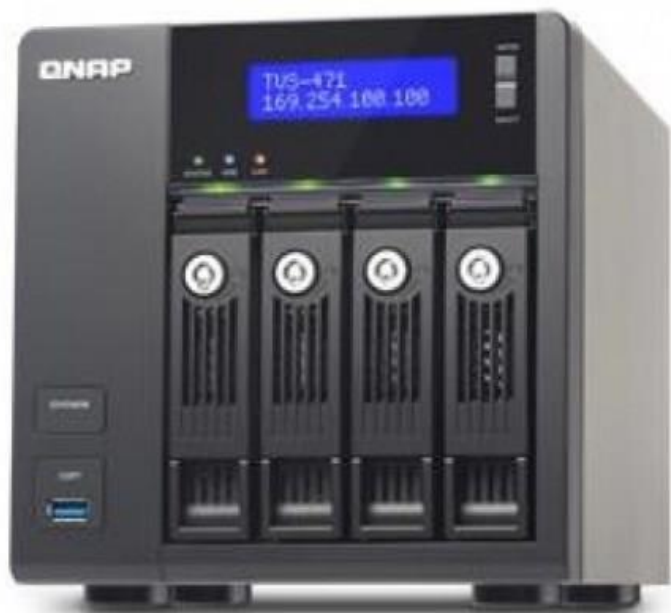
室內空氣品質連續監測系統