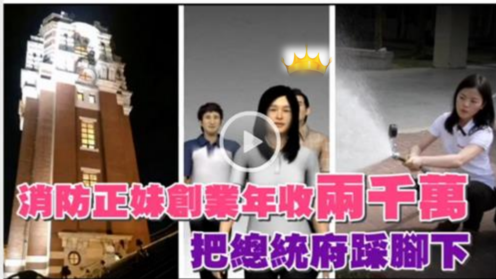
工讀生變消防女老闆 她有這七張證照