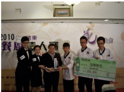
中餐廚藝團隊2010餐廚達人冠軍