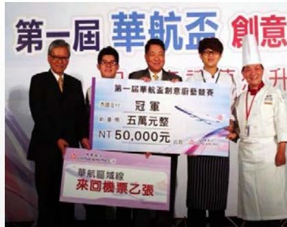
中餐廚藝團隊2013第一屆華航盃冠軍