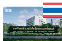
泰國/華康國王科技大學 科大排名第一 King Mongkut's University of Technology Thonburi