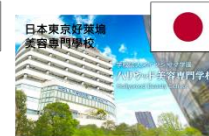
日本東京好萊塢美容專門學校