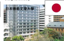
日本德島文理大學